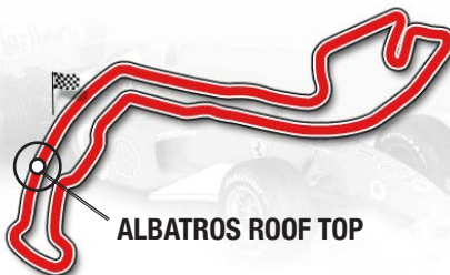
ALBATROS ROOF TOP

Each guest will have an official pass issued by the Monegasque authorities to access the terrace.