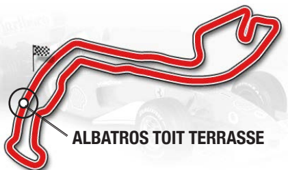
ALBATROS TOIT TERRASSE

Chaque invité aura un pass officiel délivré par les autorités monégasques pour accéder à la terrasse.