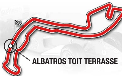
ALBATROS TOIT TERRASSE

Chaque invité aura un pass officiel délivré par les autorités monégasques pour accéder à la terrasse.